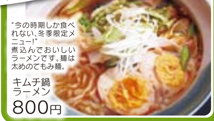
「今の時期しか食べられない、冬季限定メニュー」 煮込んでおいしいラーメンです。麺は太めのもみ麺。 キムチ鍋ラーメン 800円