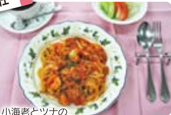
小海老とツナのトマトスパゲッティ (サラダ・コーヒ付) 1,000円

温泉郷で唯一、洋食が味わえます。おすすめは月替りで変わるスパゲッティ。季節の食材を使いながら、雰囲気のあるレストランでどうぞ。