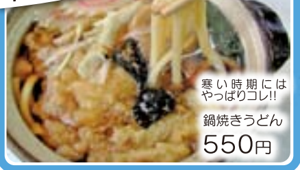
寒い時期にはやっぱりコシ!! 鍋焼きうどん 550円